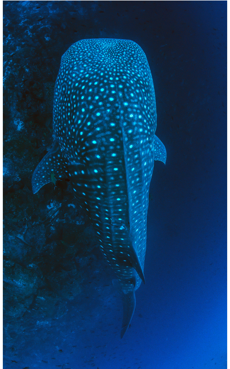
Tiburón ballena.