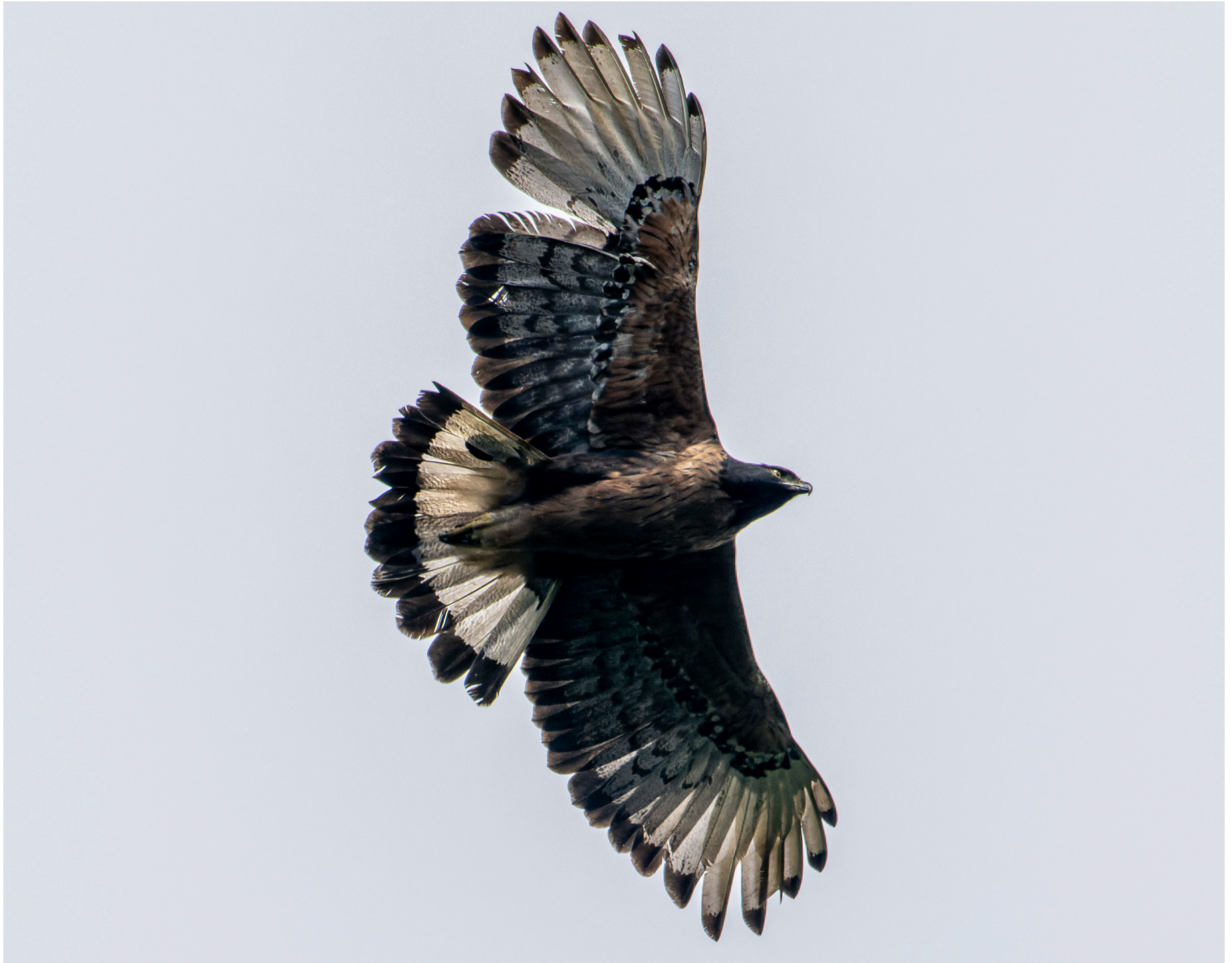
Águila Andina (en Peligro de Extinción) en la reserva Yanacocha.