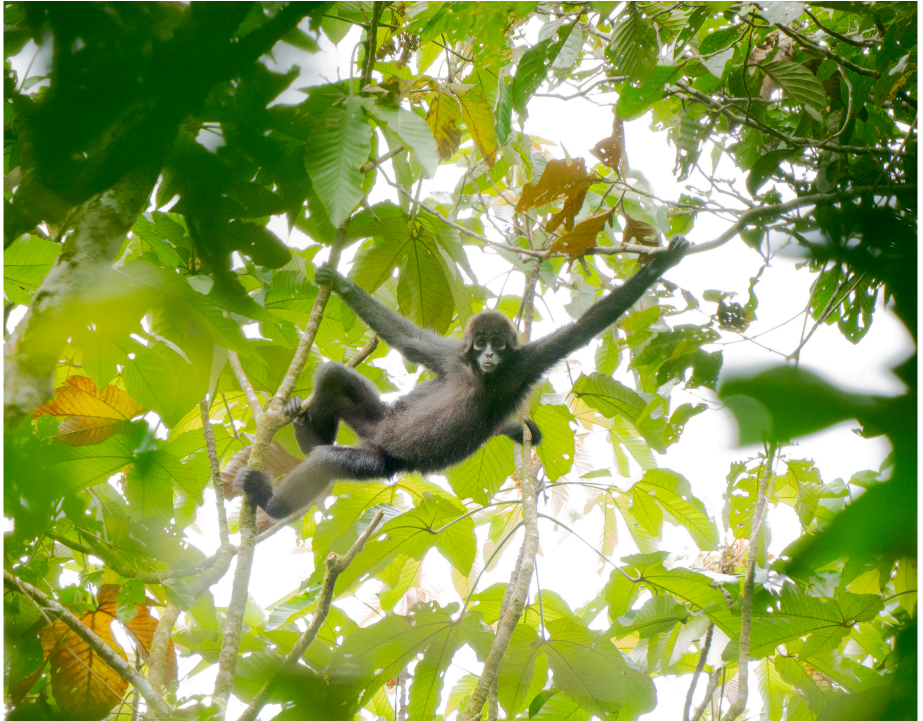
Mono araña de cabeza marrón, especie en Peligro Crítico de Extinción.