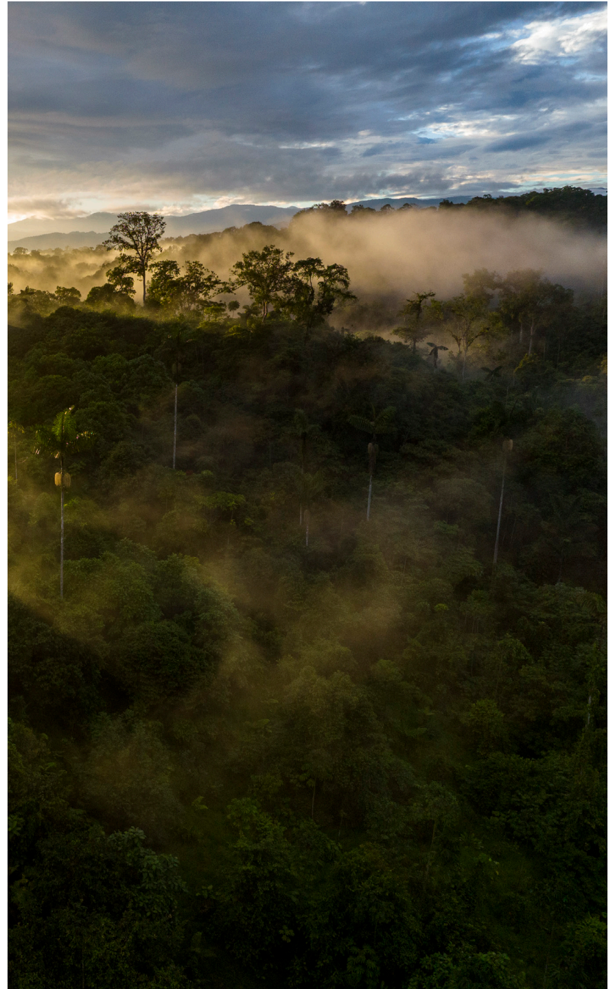
Reserva Canandé.