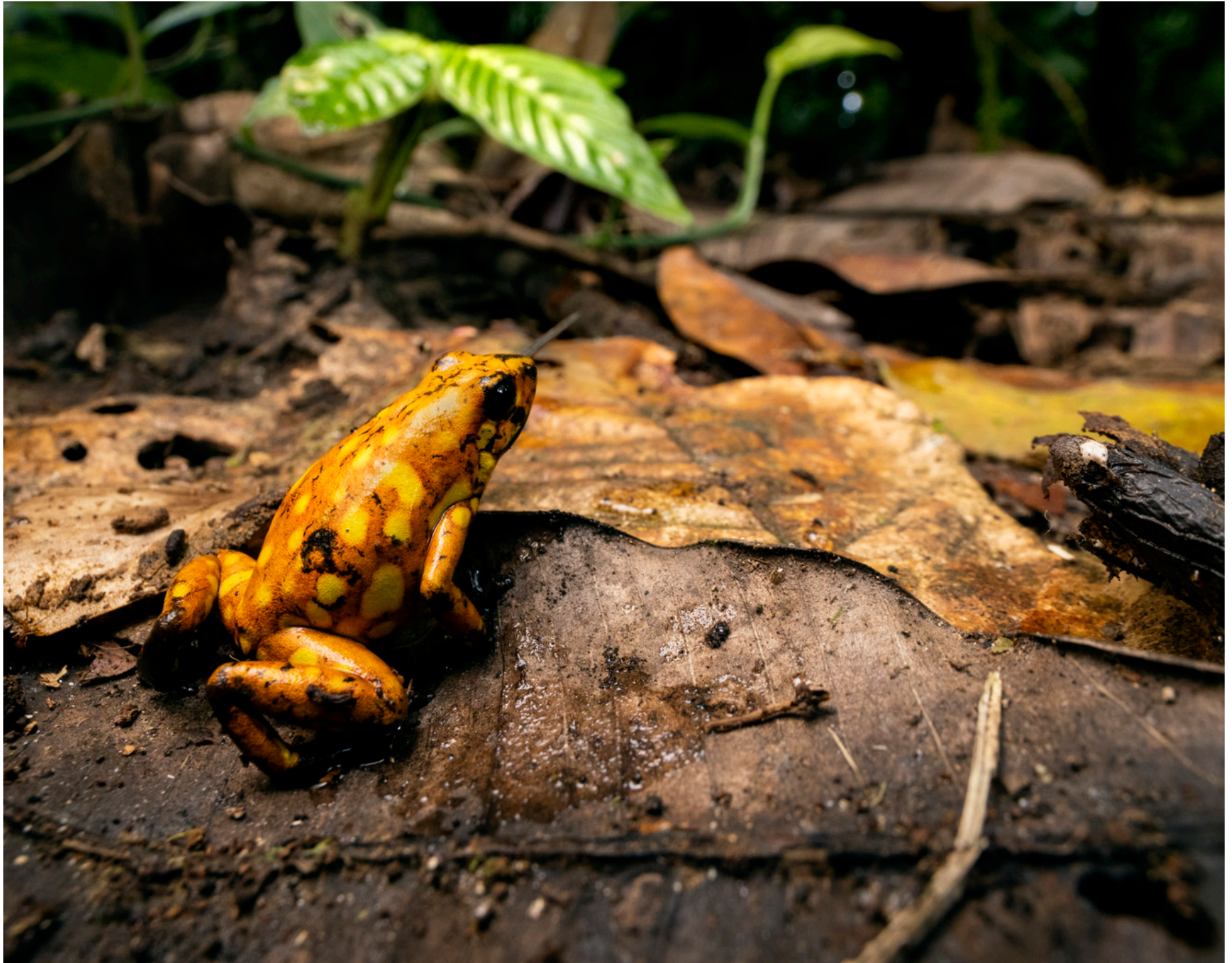
Oophaga sylvatica .