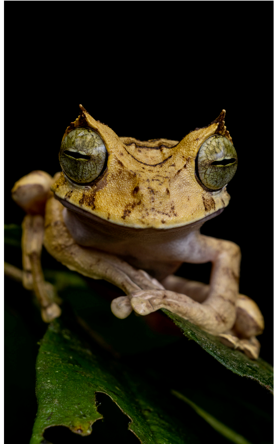
Rana marsupial cornuda en Peligro de Extinción. Fotografía: James Muchmore